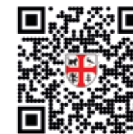
novinky do mobilu

Na první dobrou tak snad najdete vše, co potřebujete vědět – třeba nejbližší události, úřední hodiny, hlášení rozhlasu, mapu obce, informace o sběrném dvoře, aktuality a kontakty. Události je možné přes aplikaci na jeden klik přidat do kalendáře – hodí se, pokud nebudete chtít zapomenout třeba na adventní rozsvěcení vánočního stromku nebo klidně na vývoz popelnic. Spolky budou mít k dispozici vlastní přístup, což by mohlo pomoci pravidelnější aktualizaci informací.