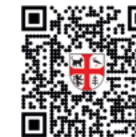
novinky na e-mail