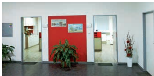
d) kanceláře, kuchyň: odpady, voda, nová podlaha, výmalba, nové vybavení