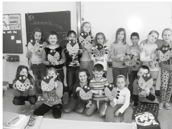
Druháci ZŠ Poltár s prvním vyřešeným úkolem.

Prvníáci se v rámci projektu „Bystré hlavičky, šikovné ručičky“ seznamují se žáky druhého ročníku na ZŠ v Poltari. Děti si vyměňují matematické úkoly. Za správné řešení získávají písmenka, které tvoří tajenku. Tu pak výtvarně a hudebně zpracují. Zajímá Vás, jak se jim práce daří? Mrkněte na: http://twinblog.etwinning.net/71337/ .